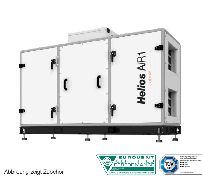
Abbildung zeigt Zubehör