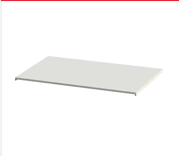
AIR1-AAD KR KW + DX XHP