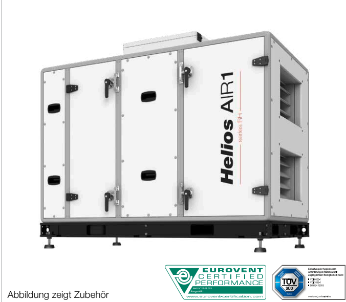
Abbildung zeigt Zubehör