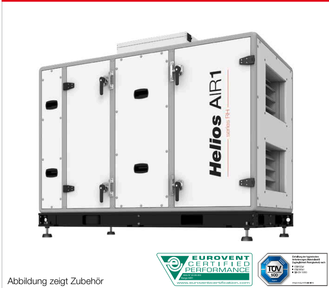
Abbildung zeigt Zubehör