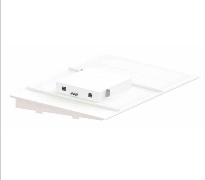
AIR1-AAD RH .../ULM