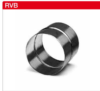
■ Rohrverbinder aus Stahlblech, verzinkt.