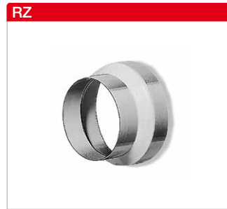
■ Reduzierungen aus verzinktem Stahlblech bzw. Kunststoff*.