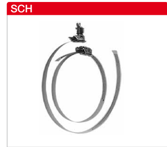
■ Schlauchschellen Metallband mit Spannschloss. Lieferung als Verpackungseinheit mit jeweils 10 Stück.