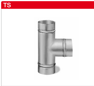
■ T-Stücke aus Stahlblech, verzinkt.