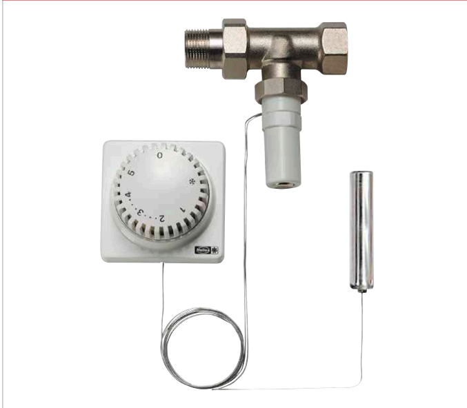
Schéma d'installation WHR